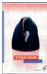
TITAN NOIR Florence Aubry Rouergue