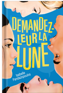
Demandez-leur la lune Isabelle PANDAZOPOULOS Gallimard